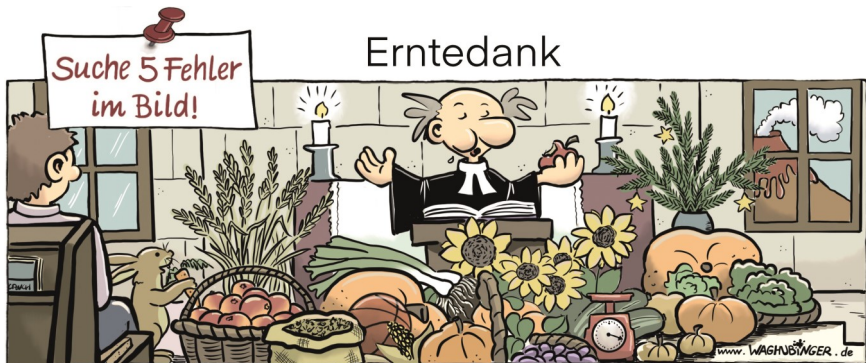
Hase, Basketball, Küchenwaage, Tannenzweige, Vulkan